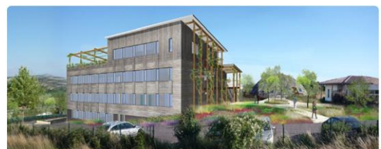
Le siège d'ECOCERT, basé dans le Gers, France.